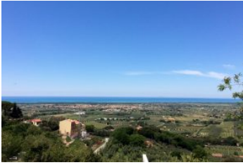
7. Castagneto Carducci Emergenza storico-culturale