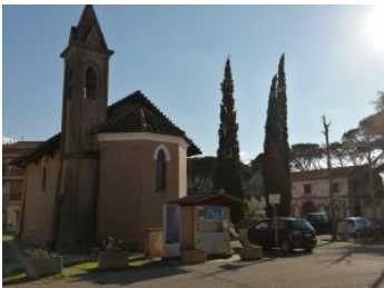
11. Ponteginori Emergenza storico-culturale

Attraversato dalla SR 68, sulla riva del Fiume Cecina nei pressi della confluenza con il torrente Trossa, è un tipico esempio di villaggio industriale nato intorno allo sfruttamento dei giacimenti di salgemma da parte della società belga Solvay. Il nome deriva dal ponte che il conte Carlo Ginori fece costruire tra il 1831 e il 1835 sul fiume Cecina