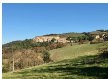
5. Canneto Emergenza storico-culturale