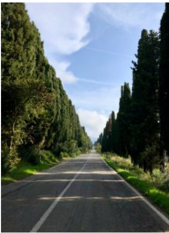
9. Bolgheri Emergenza storico-culturale