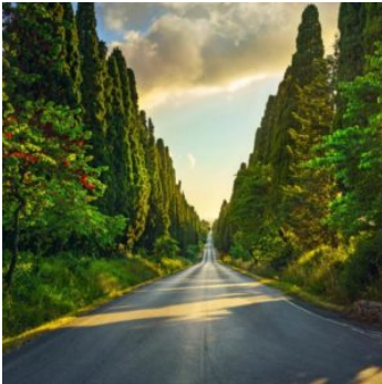
8. Strada Provinciale Bolgherese "Via del Vino" Emergenza storico-culturale, Paesaggio agrario