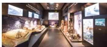
3. Museo della Geotermia Emergenza storico-culturale, Geosito - archeologia mineraria