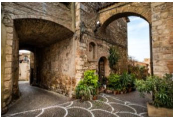
10. Bibbona Emergenza storico-culturale